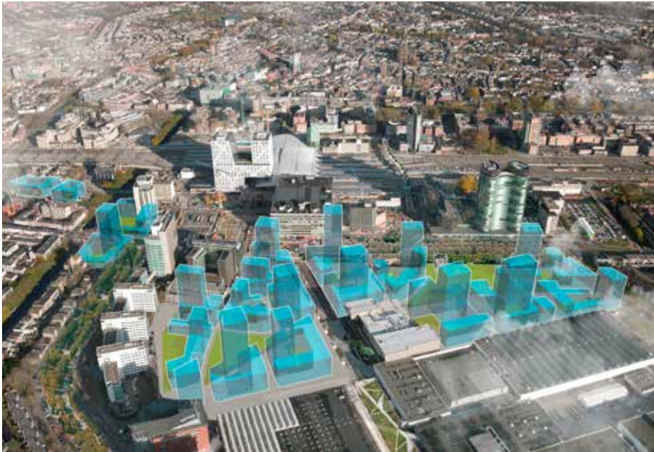
3d-verbeelding omgevingsvisie Beurskwartier Lombokplein.